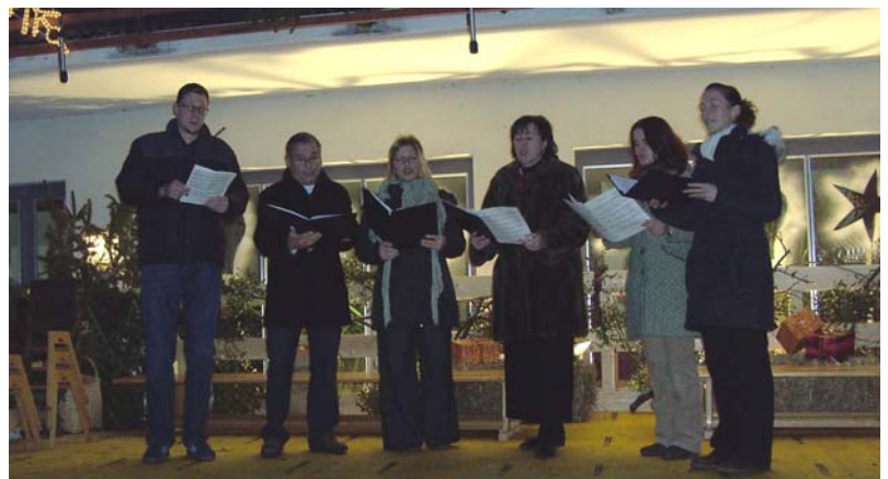
und des Aschbacher Gesangsensembles