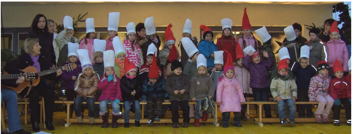
Stimmungsvolle Darbietungen der Kindergartenkinder,